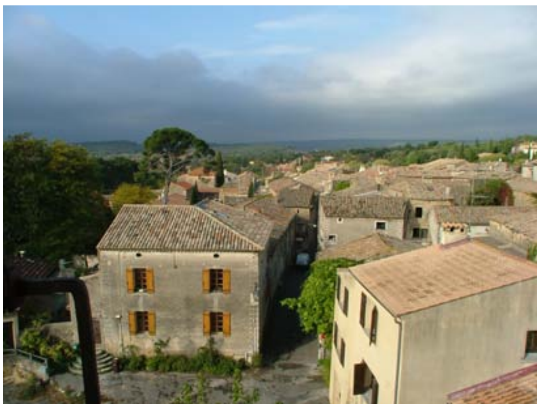
Vue du village depuis le clocher

Enfants et adultes, natifs de Vallabrix ou pas, si vous aimez le village, si vous trouvez dans son clocher tout rond une source d'inspiration, n'hésitez pas à vous lancer dans cette aventure d'écriture. La boîte à idées de la mairie recueillera vos contributions, un comité de lecteurs bienveillants lira les productions et assurera la publication des textes sous la forme d'une exposition. Le texte qui fera l'unanimité sera publié dans la gazette. A vos plumes pour une histoire de clocher !