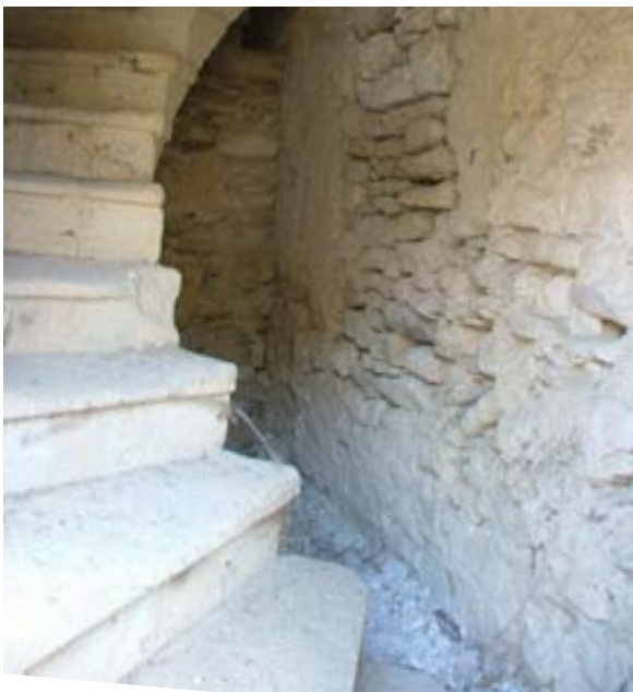
Les marches du clocher