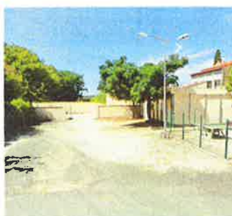
Accès et cour du hangar communal

L'emprise de projet est à ce jour largement artificialisée avec en limite Ouest, le hangar communal et sa cour d'accès ; au centre les préfabriqués abritant 2 salles de classes ; en limite Est, une petite cour attenante délimitée par un grillage le long de la voie d'accès bordée d'arbres.