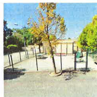
Cour attenante aux préfabriqués