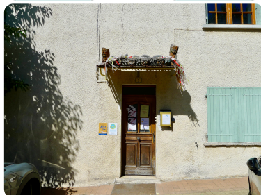
1 Place de la Liberté