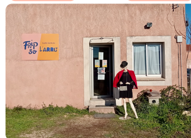
A côté de notre local